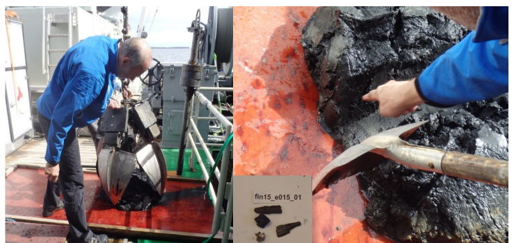
Den vänstra bilden är tagen vid sedimentprovtagning i Ljusnefjärden. Högra bilden visar fiberrika sediment.

Projektet kommer även att presenteras på Renare Marks Vårmöte 2017.