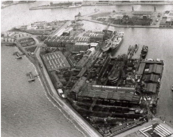
En något annorlunda version av Västra Hamnen, tagen 1938, där det bland annat fanns möjligheter till bad. Läs mer om badmöjligheter i dåtidens Västra Hamnen här .

Det har blivit en tradition i Nätverket att bjuda in till ett studiebesök i anslutning till Vårmötet. Denna gång besöker vi Västra Hamnen för att få följa med på vägen från Ax till limpa i praktiken.