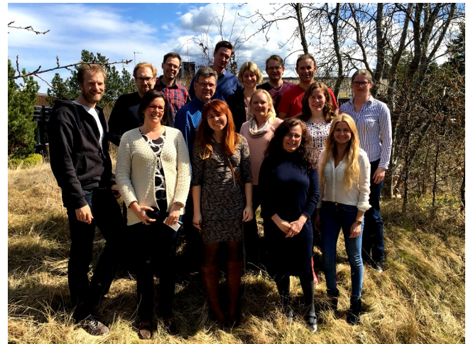
En glad och nästan fulltalig styrelse under två intensiva planeringsdagar vid styrelsens kickoff 2016.