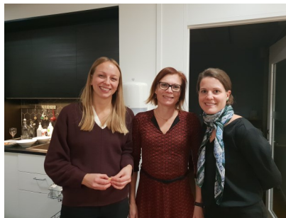
Arrangörerna från region Mälardalen