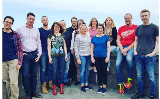
En glad och nästan fulltalig styrelse under två intensiva planeringsdagar vid styrelsens kickoff 2018.