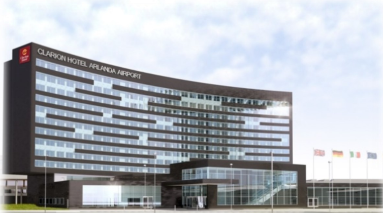
Den 20-21 mars ses vi på Arlanda för 2019 års Vårmöte!

Vatten och Sediment är ett temat på nästa års vårmöte. Ett första program är klart, och vi har lovar att alla kan hitta pass som intresserar er! På anmälnings-sidan hittar ni programmet som bland annat rymmer juridik, mikroplaster, PFAS, spridning och provtagning, riskbedömning, åtgärder och forskning.