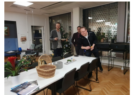
Renare marks styrelse gjorde bra ifrån sig i pingisbollstävlingen.

Text och foto: Hanna Hartmann, Enviro Miljöteknik