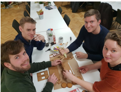
Ramböll i full fart med att bygga sin pepparkaksbil.

Den 5 december hölls den traditionsenliga Miljökampen i Uppsala. På WSP:s kontor samlades ett 20-tal deltagare för att tävla i mimitävling, skulpterande av potatis, äta pepparkakor och vissla, träff med pingisboll och pepparkaksbygge. Kvällen bjöd på många härliga skatt innan ett vinnande lag korades. Årets vinnande lag blev värdarna WSP i Uppsala, stort grattis!