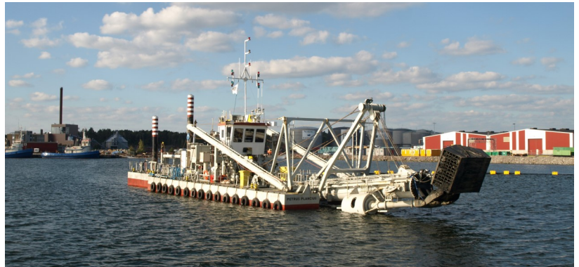
Den 27 september fick Renare Marks medlemmar chansen att vara med vid invigningen av hamnsaneringen i Oskarshamn. Läs mer om hamnsaneringen på sidan 3 .

Nätverket Renare Mark c/o Ekorola AB Fabriksgatan 23 891 33 Örnsköldsvik