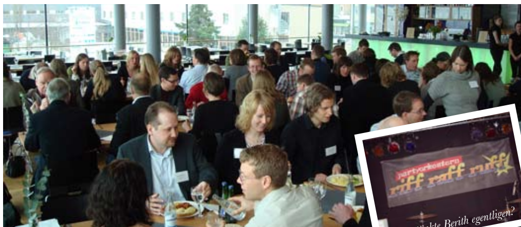
Referat från Renare Marks vårmöte 2008...

PÅ MITT BORD som Länsstyrelsetjänsteman finns en mångfald av frågor kopplade till förorenade områden. Under Renare Marks vårmöte fick jag tillfället att vidga min insikt för flera av dem.