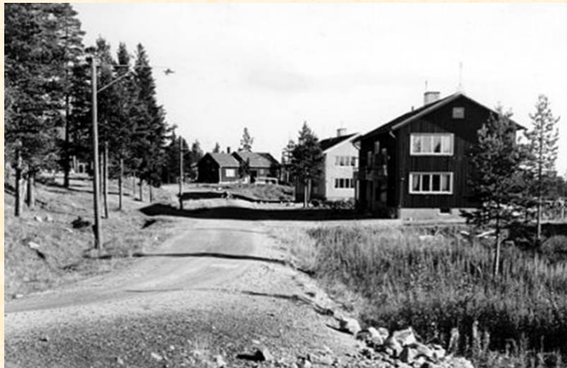
Adaks samhälle. 1953