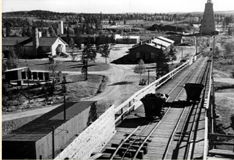
vy över industriområdet med Adaklaven till höger. 1952.