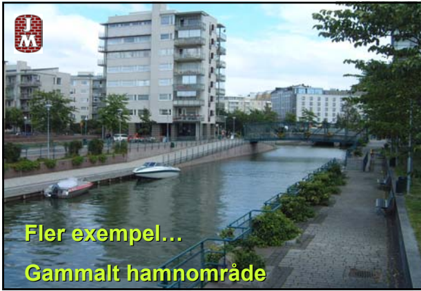
Fler exempel... Gammalt hamnområde