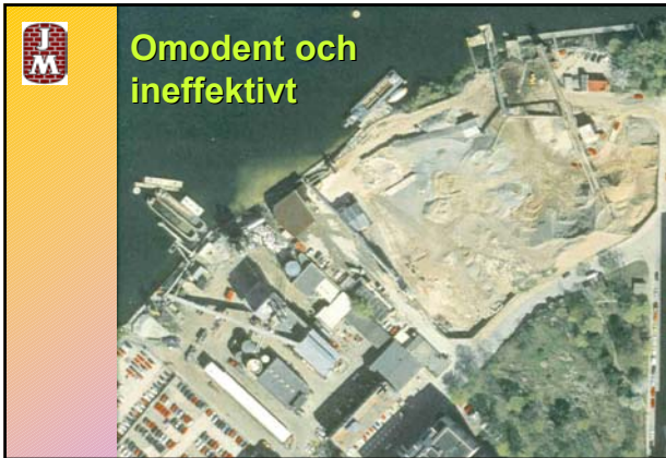
Omodernt och ineffektivt