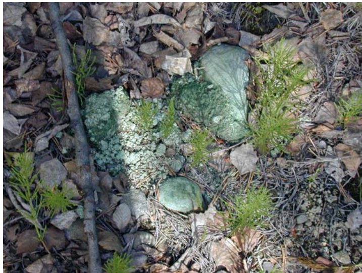
CCA-förorenat jord, närbild

Nätverket Renare Mark är en obunden intresseorganisation för alla som arbetar med förorenade områden. Nätverkets vision är att vara ett forum för att främja utvecklingen inom efterbehandling av förorenade områden. Nätverket erbjuder mötesplatser för tvärvetenskapligt informationsutbyte. Nätverket anordnar möten och seminarier där aktuella frågor och erfarenheter diskuteras. På vår hemsida ( http://www.renaremark.se ) finns föreningsdokument, nationella och internationella branschnyheter och annan information. Medlemmarna får också information via E-post och elektroniska nyhetsbrev.