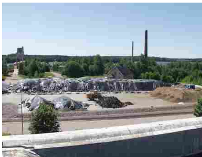
Öppna och slutna behandlingsceller.

Jordbehandling och grundvattenrening är komplicerade områden som kräver kunskap, erfarenhet och tekniska lösningar. Soilrem och MB Envirotech har tillsammans dessa kompetenser. Vår ambition är att vara ledande i Norden och Storbritannien när det gäller att hitta miljöekonomiska lösningar. Vi utför både mindre och större marksaneringsuppdrag, vilka kan omfatta delåtgärder eller helhetslösningar.