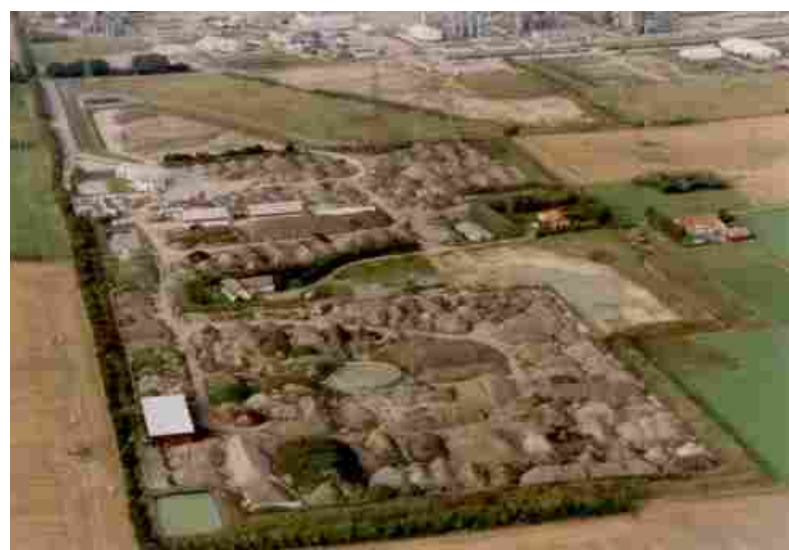
Öppna och slutna behandlingsceller.

För metallföroreningar: Fraktionering, jordtvätt, immobilisering och elektrosanering.