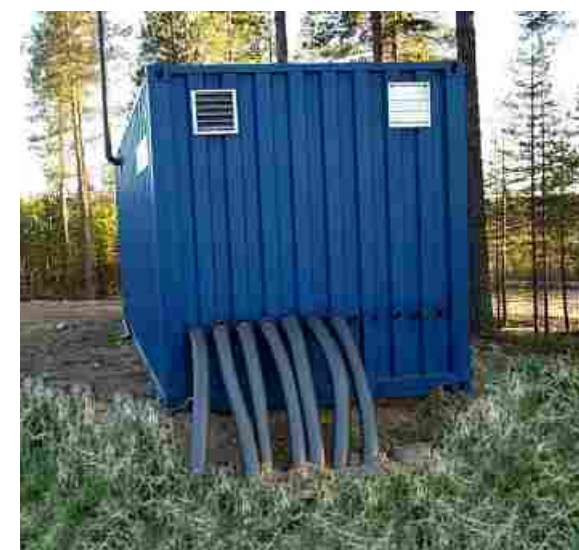
In-situ sanering av lösningsmedel innehållande klorerade föroreningar.